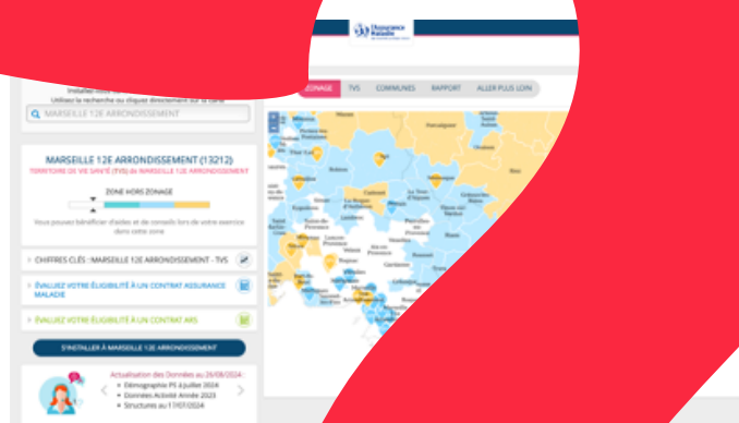
PORTAIL RÉZONE MÉDECIN